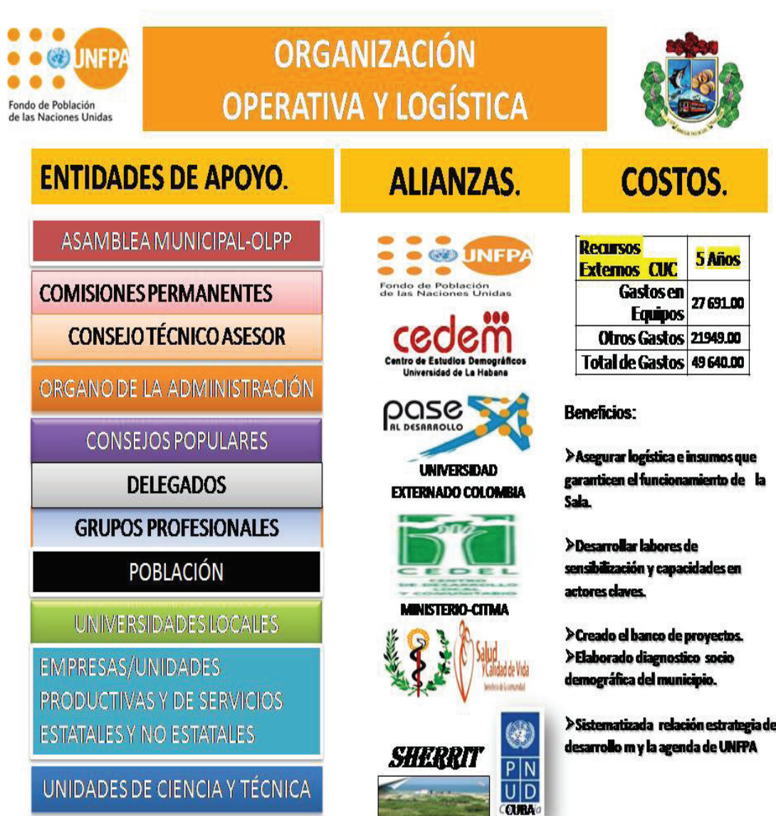
Figura 4. Proyecto “Sala para la Gestión del Conocimiento en Dinámica de la Población, Salud y Calidad de Vida”: Entidades de Apoyo, Alianzas y Costos.