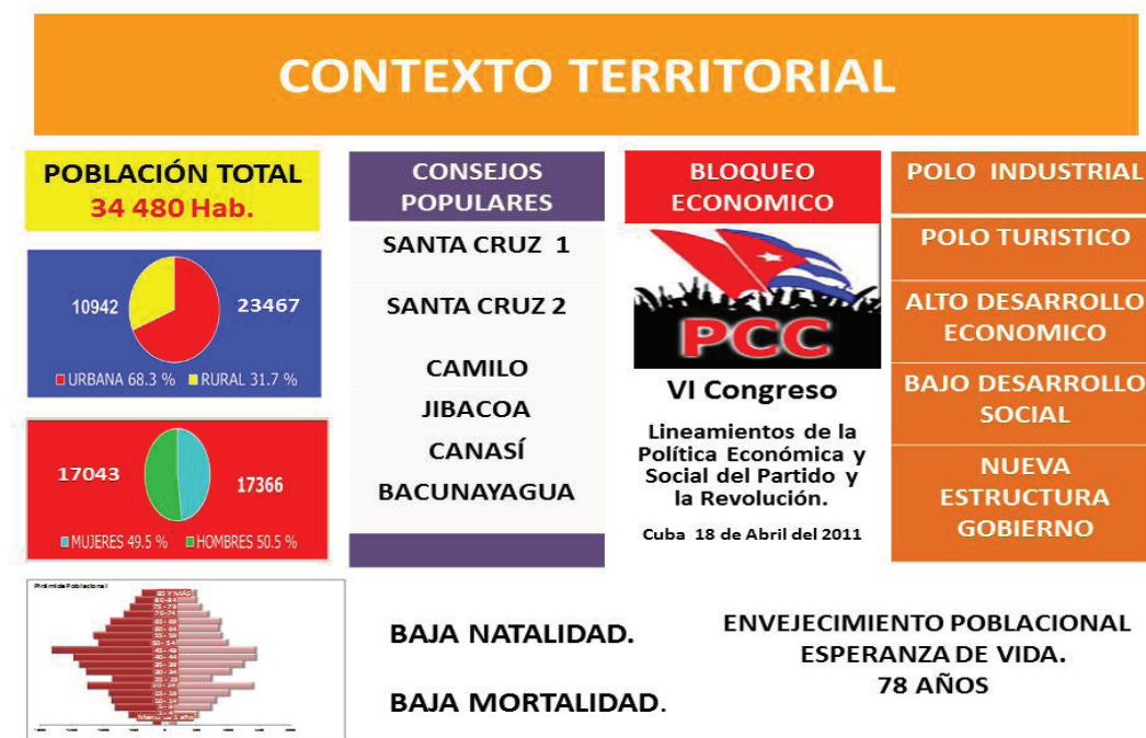
Cuadro 9. El contexto demográfico en el municipio Santa Cruz del Norte, Mayabeque.