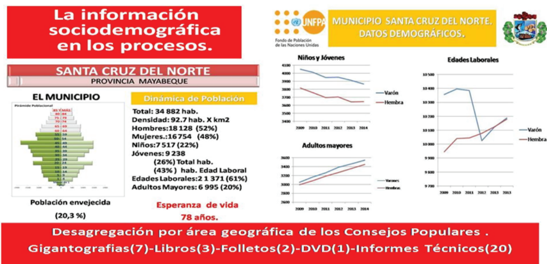
Figura 1. Santa Cruz del Norte: datos demográficos seleccionados, 2015.