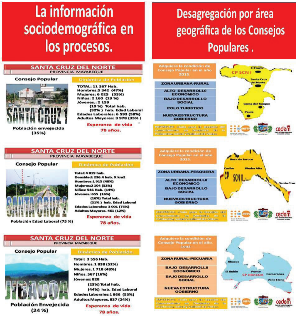
Figura 2. Santa Cruz del Norte: información sociodemográfica y económica según áreas geográficas de los consejos populares Santa Cruz –1, Santa Cruz –2 y Jibacoa, 2015.