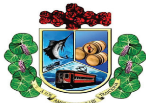
Gobierno Municipal de Santa Cruz del Norte Mayabeque